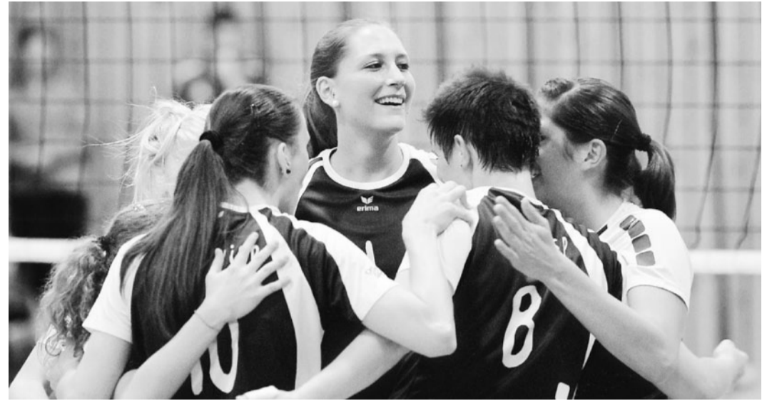
Leader. Die Visperinnen gaben gegen Eyholz den ersten Satz ab, steigerten sich danach und konnten am Schluss über den verdienten Sieg jubeln.

Während des ganzen Spiels musste man einige Schockmomente hinnehmen.